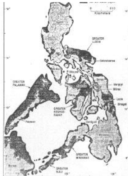
Karte der Philippinen

Zum anderen besteht das Land natürlich aus Inseln, die durch die genetische Isolation ihrer tierischen und pflanzlichen Bewohnern die Entstehung neuer Arten und Unterarten be-