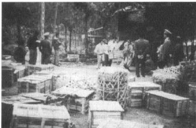
Beschlagnahmter Tiertransport.

Trotz dieser bauaktiven Zeiten in den vergangenen Jahren platzt unsere Einrichtung schon wieder aus allen Nähten. Schuld daran ist neben den