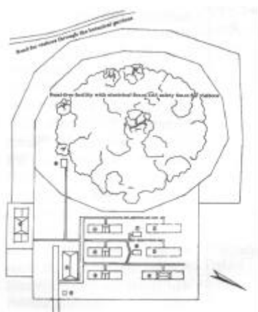
Lageplan des Primatenzentrums in Cuc Phuong 1 Wohnhaus 2 - 4 Gehege für Gibbons und Languren 5 Gehege mit heizbarem Haus für Kleideraffen 6 - 7 Gehege für Plumploris 8 1,5 ha großes Waldgehege für Languren 9 Generatorhaus, 10 Quarantänestation 11 Weitere Gehegekomplexe (in Bau) Zeichnung: Tilo Nadler

WIRTH, R. (1995): Das Primatenprojekt in Vietnam. Mitteilungen der ZGAP 11/1. S. 1 - 4