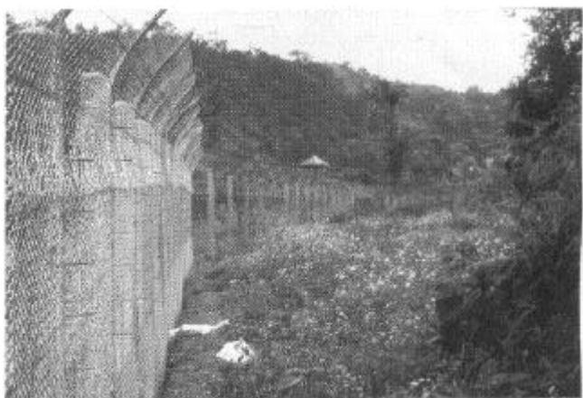
"Affensicherer" Zaun des 15.000 qm großen Freigeheges.

Dennoch sind die Beschlagnahmen wohl nur die Spitze des Eisberges, und wenn auch über das Gesamtvolumen des Handels nur spekuliert werden kann, ist dieses ohne Zweifel hoch - zu hoch im Vergleich zu den kleinen und auch durch Lebensraumzerstörung bedrohten Restbeständen dieser Tierarten.